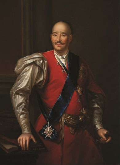
Портрет Францішека Салезія Потоцького (1700-1772). Автор. М. Баччареллі

Історія палацу Потоцьких завжди була в центрі найважливіших подій міста Кристинополя, а згодом і Червонограда. Палацово-парковий комплекс за проєктом французького інженера й архітектора П'єра Ріко де Тірреґая постав у 1757-1761 роках на місці давнього замку Потоцьких. Резиденція, збудована на замовлення Францішека Салезія Потоцького, що поєднала стилі бароко та раннього класицизму,